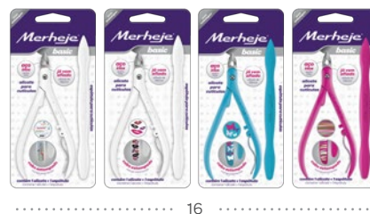
CABO C/ ESTAMPA (v.2 - BEIJOS, FRASES, BORBOLETAS, LISTRAS)