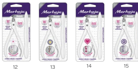
CABO C/ ESTAMPA (v.1 - ESTRELAS, FLORES, CORAÇÕES E ANÉIS)