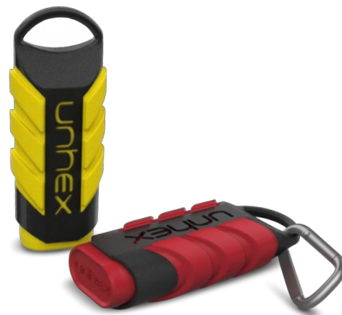
ESTOJO 02 UNHEX SPORT (ESTOJO + 1 CORTADOR DE UNHAS + MOSQUETÃO)