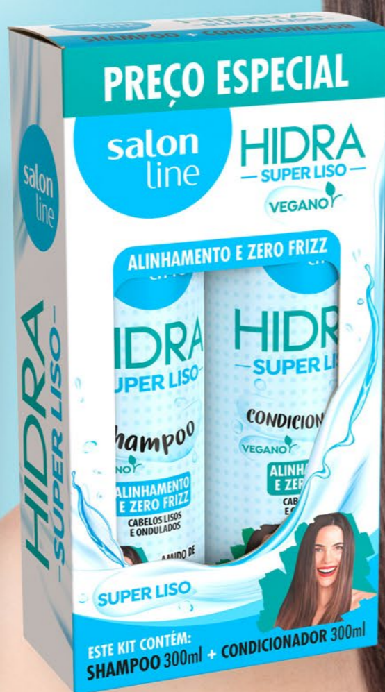
1. Hidra Super Liso Kit Shampoo + Condicionador 300ml 95687