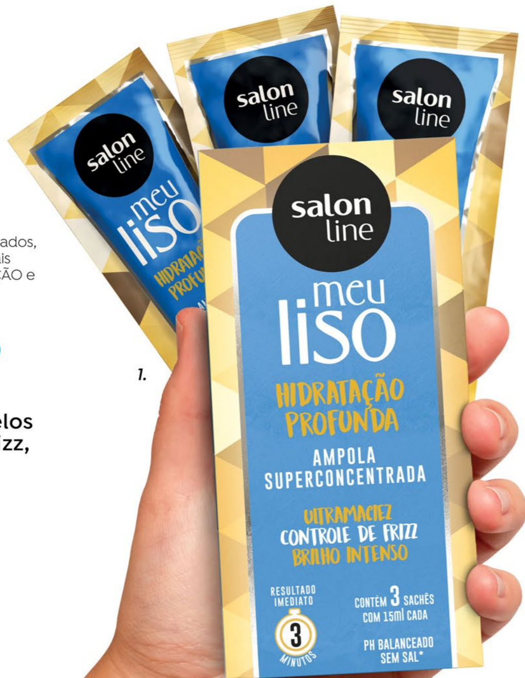
1. Meu Liso Kit Ampolas Hidratação Profunda 45ml 95551