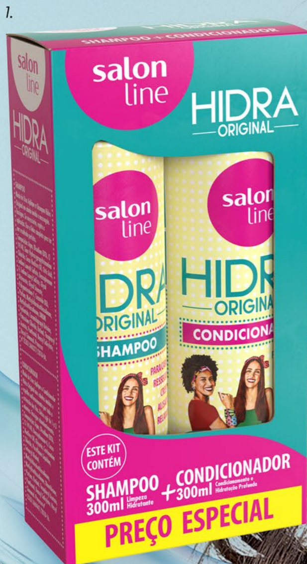
Hidra Original Kit Shampoo + Condicionador 300ml 95294

Perfeito para cabelos ressecados, crespos, alisados e relaxados.