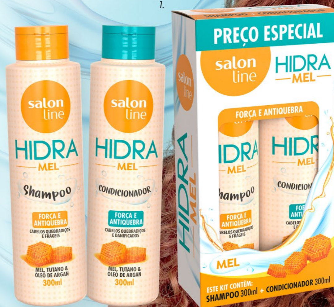
1. Hidra Mel Kit Shampoo + Condicionador 300ml 95686

ÓLEO DE ARGAN Possui ômega 6 e vitaminas com alto poder de nutrição, hidratação, combate contra as pontas duplas e tem efeito antifriz.