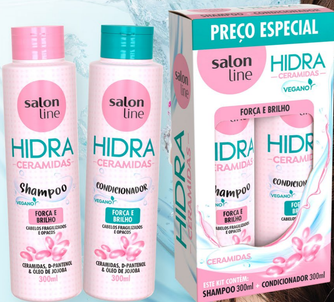
1. Hidra Ceramidas Kit Shampoo + Condicionador 300ml 95671

Condicionador – Combate contra os danos diários, hidratando e nutrindo os fios.