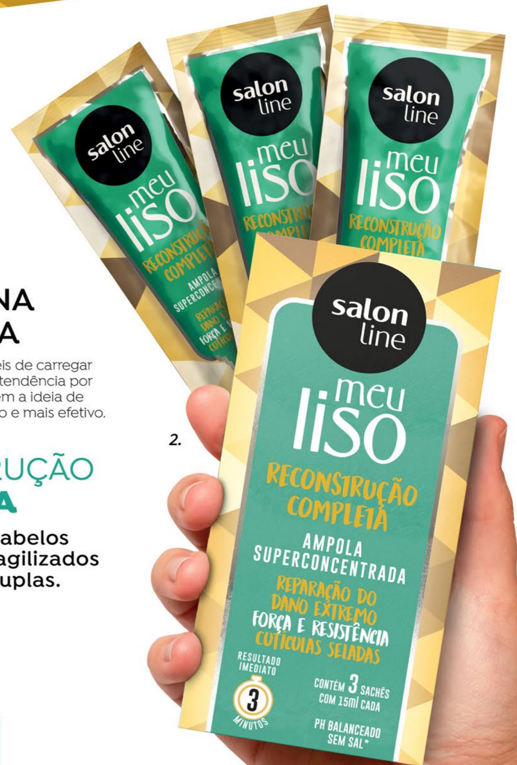
2. Meu Liso Kit Ampolas Reconstrução Completa 45ml 95550