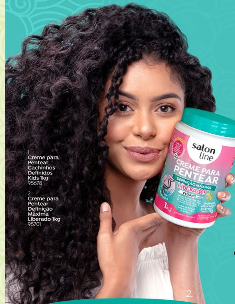
1. Creme para Pentear Cachinhos Definidos Kids 1kg 95678 2. Creme para Pentear Definição Máxima Liberação 1kg 95701

ÓLEO DE COCO: Fortalece os fios, proporciona hidratação, nutrição, brilho e maciez extrema.